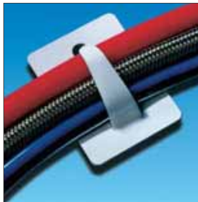
Den bøybare metallnesen gjør det mulig å feste forskjellige kabelstørrelser.

Med disse klipsene kan man enkelt feste kabler, ledninger eller slanger.