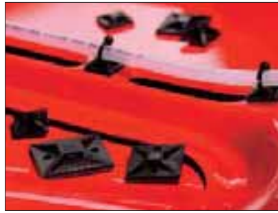
SolidTack® serien kan benyttes på lakkerte og pudderbelagte overflater.

SolidTack® har et meget sterkt feste på malte overflater. Limtapen er laget av acrylatmasse med en god klebrighet. Med disse egenskapene er det også mulig å bruke tapen på plastikk med lav overflateenergi som PP og PE.